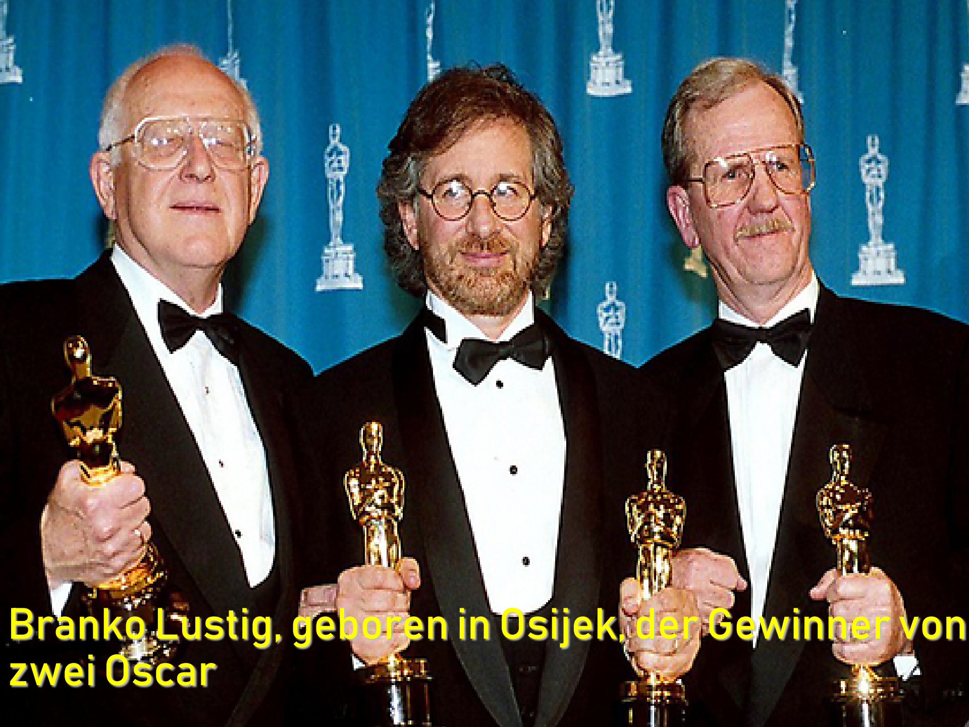
Branko Lustig, geboren in Osijek, der Gewinner von zwei Oscar